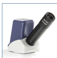
Cabezal digital monocular