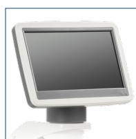
Cabezal con pantalla LCD