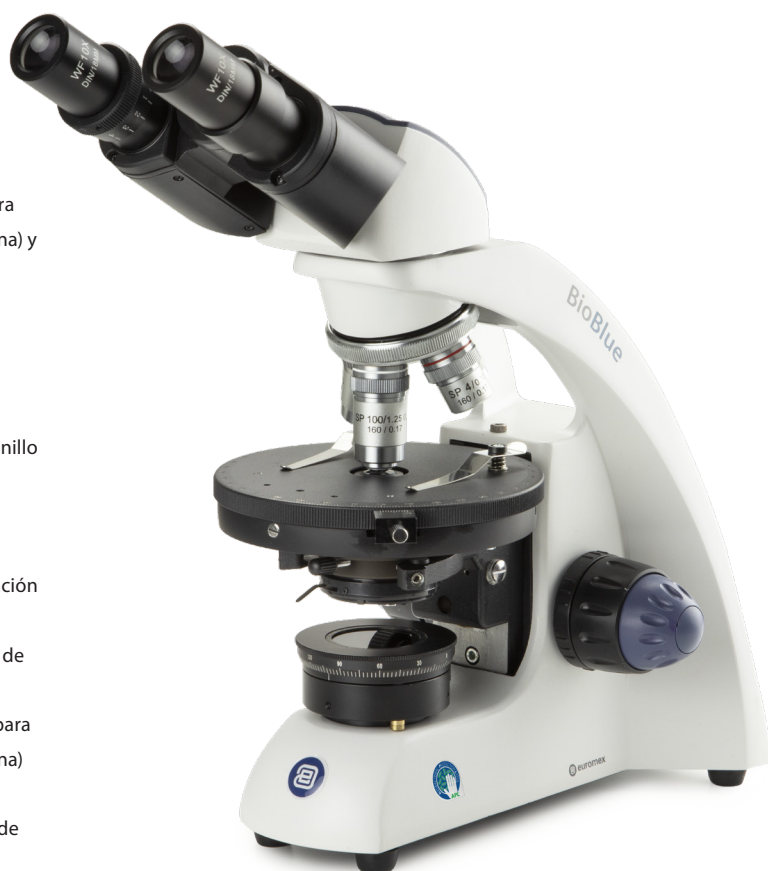
● Modelo de polarización BB.4260-P-HLED

APL (Anti-bacterial Protection Layer) es un tratamiento de pintura revolucionario que se aplica a las partes más críticas de nuestros productos. Un microscopio con APL restringirá el crecimiento de microorganismos, incluidas bacterias y moho