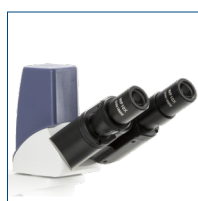
Cabezal digital binocular