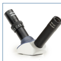
Cabezal de discusión